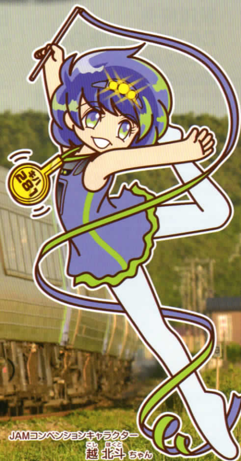
JAMコンベンションキャラクター 越北斗ちゃん