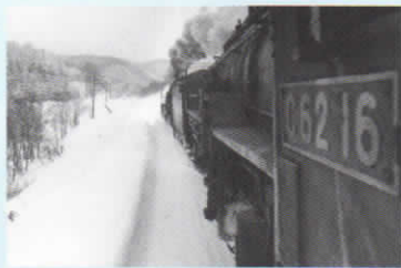
*写真展は17日(金)~19日(日)常設です。